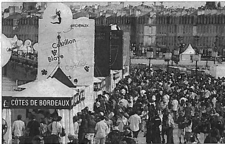
L'édition 2010 avait accueilli plus de 500 000 visiteurs.

Le programme 2012 s'est développé autour d'un thème fédérateur : « Bordeaux aime le monde, le monde aime Bordeaux ». Philippe Castéja, président du Conseil des grands crus classés en 1855, s'y associe de bon cœur en proposant de