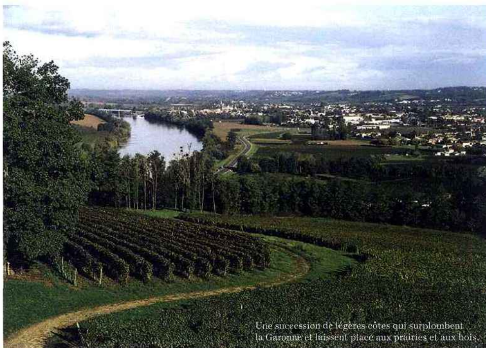
Une succession de légères côtes qui surplombent la Garonne et laissent place aux prairies et aux bois.

4 rue Issartier Monsegur Tél. 05 56 61 82 73 tourisme.entredeuxmers.com