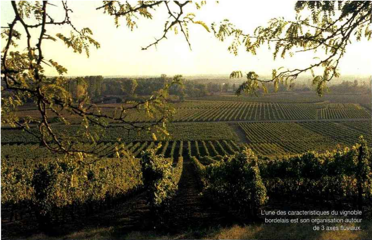
L'une des caractéristiques du vignoble bordelais est son organisation autour de 3 axes fluviaux.